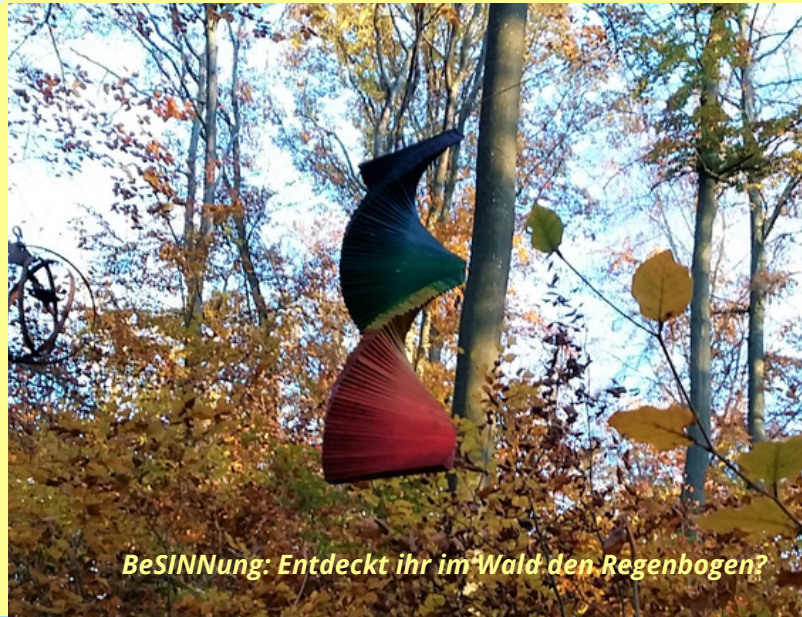
BeSINNung: Entdeckt ihr im Wald den Regenbogen?

Vielleicht wird der Weitblick auch eine von euren Lieblingsstationen: Wenn ihr euch Handpuppen mitbringt, könnt ihr nämlich prima die Fensterläden von einer kleinen "Bühne" aufklappen und euer Theaterspiel beginnen, während die Zuschauer auf der Bank davor Platz nehmen. In Greußenheim selbst dürft ihr übrigens - unweit der Kneipp-Anlage - ganzjährig und kostenlos den Wildkräutergarten mit allen Sinnen erkunden.