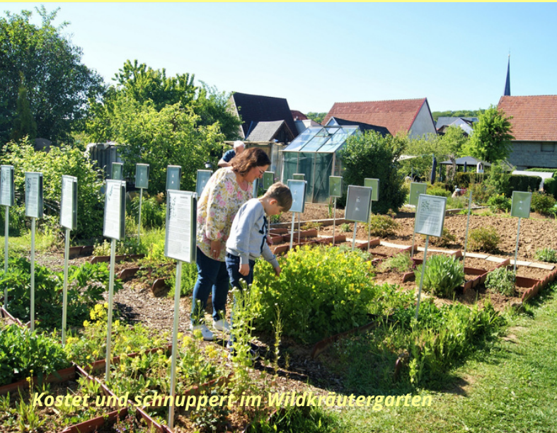
Koster und schnuppert im Wildkräutergarten