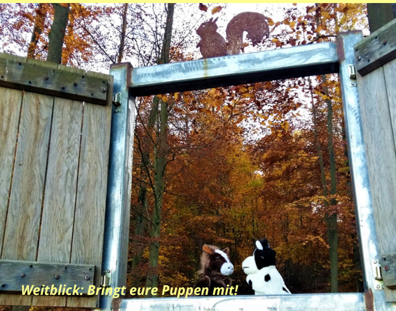
Weitblick: Bringt eure Puppen mit!