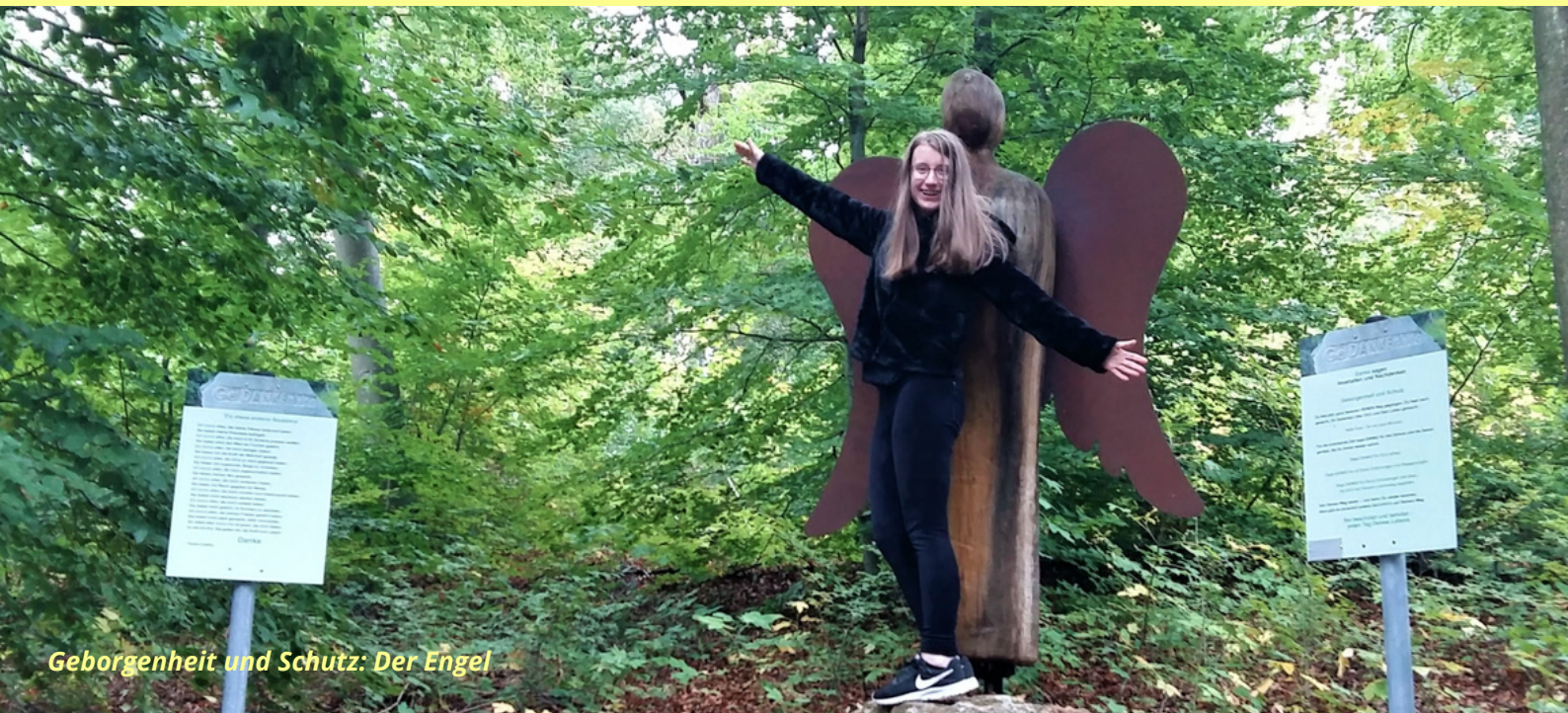
Geborgenheit und Schutz: Der Engel

Frühjahrs-Newsletter für Familien in Würzburg Nr. 8