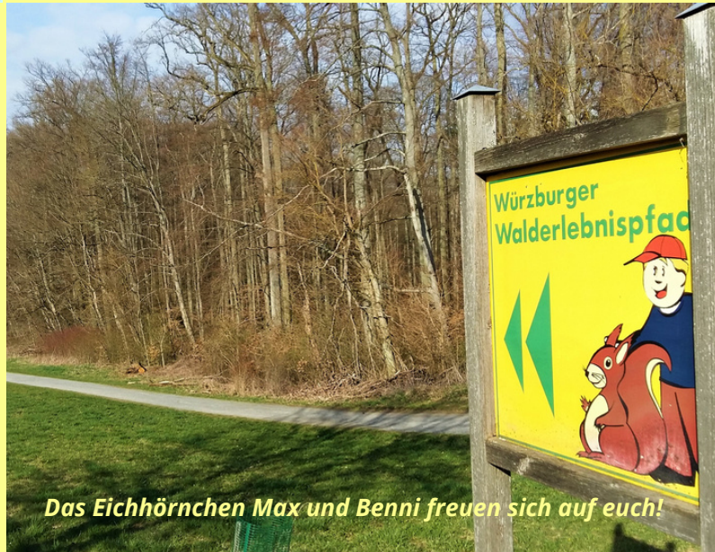
Das Eichhörnchen Max und Benni freuen sich auf euch!

Auf diesem Eichenturm könnt ihr von verschiedenen kleinen und großen Plattformen hineinblicken in Baumkronen und hinabschauen z. B. zum Meditationsweg mit seiner langen Holzwellen. Nicht weit davon verrät euch der Spechtbaum beim Aufklappen, wer so alles in Baumhöhlen sein Nest baut. Möglicherweise ist er live zu hören! Zum Austoben wartet dann sowohl der Wald- als auch vor allem der Wiesenspielplatz auf euch.