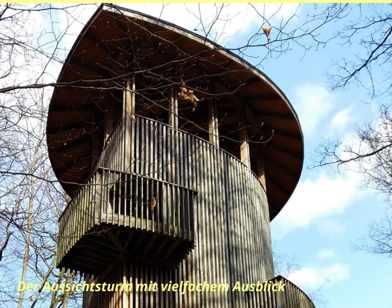
Der Aussichtsturm mit vielfachem Ausblick