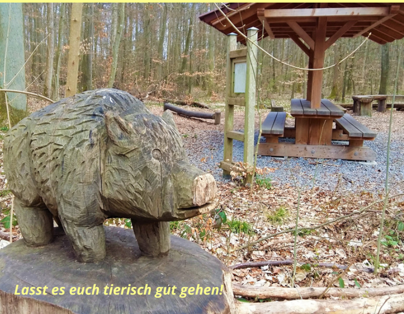
Lasst es euch tierisch gut gehen!